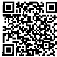
โปรดสแกน QR Code

สามารถดาวน์โหลดสิ่งที่ส่งมาด้วยได้จาก QR Code ที่แนบมาพร้อมนี้